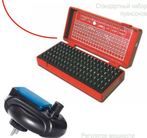
Стандартный набор пуансонов