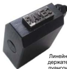
Линейный держатель пуансонов