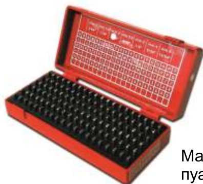
Малый набор пуансонов

Пуансоны продаются россыпью или в наборах.