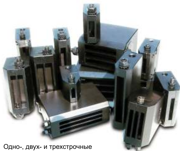
Одно-, двух- и трехстрочные линейные держатели пуансонов

Стандартные пуансоны устанавливаются в стандартный линейный держатель пуансонов, который можно использовать в ударных маркирующих аппаратах или аппаратах для круговой маркировки. Он также может быть оснащен ручкой для ручной маркировки.