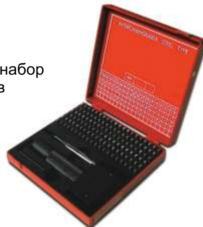
Большой набор пуансонов

Малый набор содержит 52 пуансона с буквами и 30 с цифрами, а также специальные символы. В большой набор входят 52 пуансона с буквами, 30 с цифрами, пуансоны со специальными символами, щипцы, шестигранный торцовый ключ для установки пуансона в держатель, ручная оправка и держатель пуансонов (в соответствии с высотой символов).