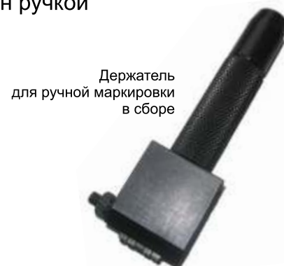
Держатель для ручной маркировки в сборе