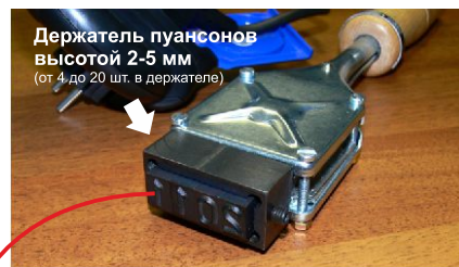
Держатель пуансонов высотой 2-5 мм (от 4 до 20 шт. в держателе)