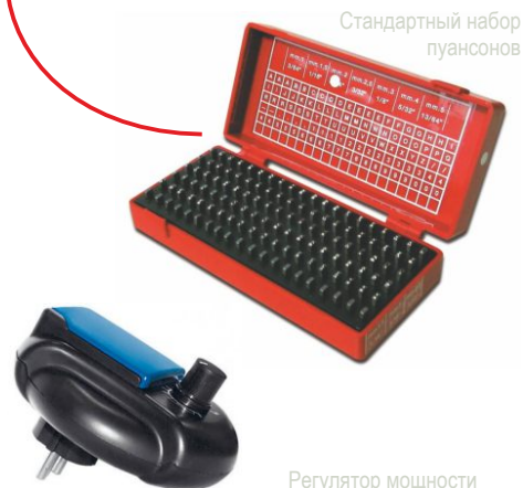
Стандартный набор пуансонов